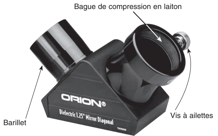
Le diagonal à miroir haute réflectivité 1,25" (31,75 mm) d'Orion

Le diagonal 2" (50,80 mm) acceptera soit des oculaires de 2" (50,80 mm) ou 1,25" (31,75 mm) en utilisant l'adaptateur d'oculaire 1,25" fourni. Si vous utilisez des oculaires de 2" (50,80 mm), retirez l'adaptateur 1,25" (31,75 mm) du diagonal.